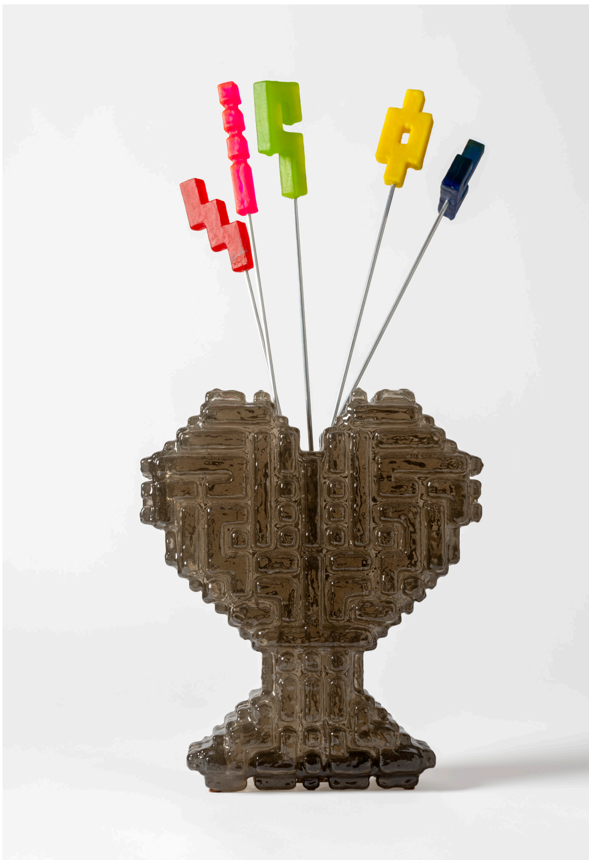
Córtex I, pieza de Las Ánimas.