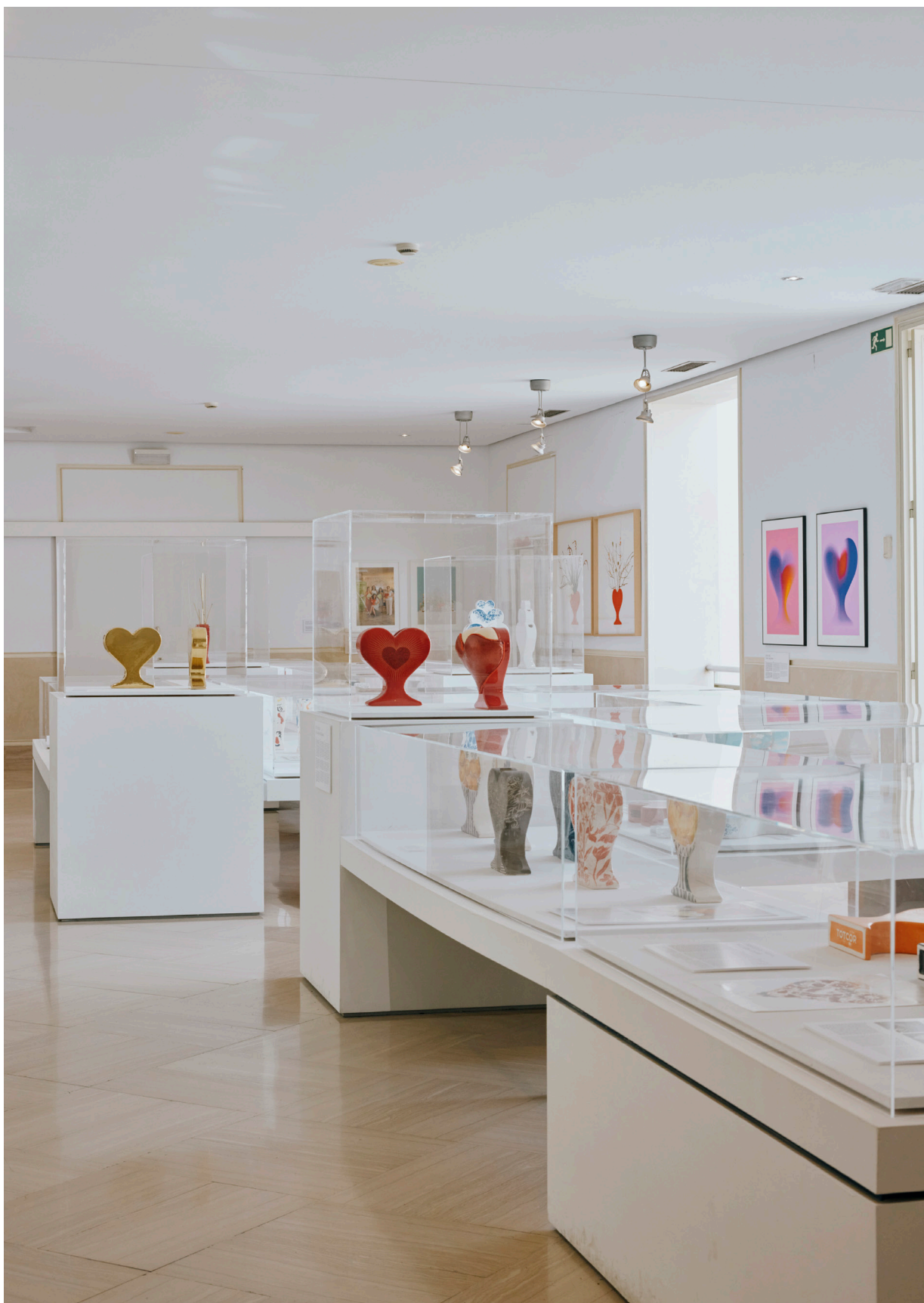
Imagen en la exposición "TotCor. Arte, diseño y artesanía hablan de amor" en el Museo Nacional de cerámica y artes suntuarias González Martí, en Valencia.